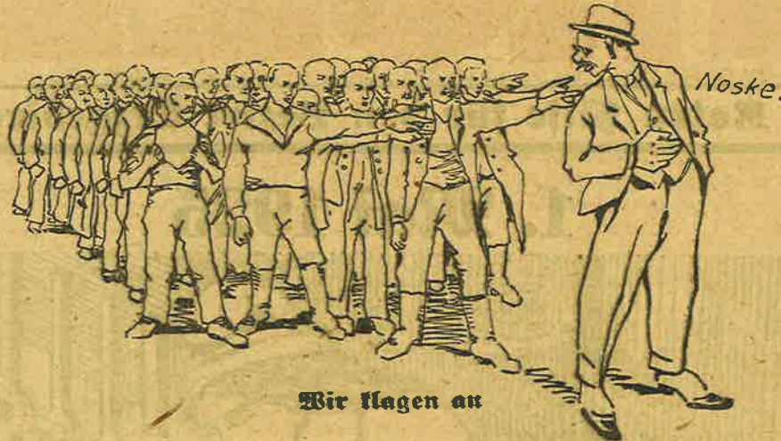
Wir hagen an

Drei Todesurteile. Für einen Augenblick hielt das Proletariat den Atem an, dann klang es wie ein einziger Schrei millionenfacher Empörung aus den Reihen der Internationale. Die Schmerzensrufe der geschundenen bulgarischen Ar-